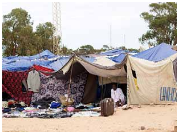
Flüchtlingslager des UNHCR an der libysch-tunesischen Grenze

Kontakte und eine regelmäßige Berichterstattung realisiert werden kann, wurden im letzten Jahr zwei Recherchereisen von Mitarbeitenden von borderline-europe und dem Schwesterverein Borderline Sicilia nach Tunesien unternommen.