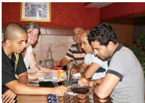
Im Gespräch mit Verwandten von aus Italien abgeschobenen Tunesiern, Tunis 06/2011

schungen nach den über 600 verschwundenen Tunesiern mittlerweile eine große Kampagne in Italien hervorgegangen, in deren Rahmen eine Delegation aus Tunesien nach Italien reiste, um ihre verschwundenen Angehörigen zu suchen. In Palermo wurden sie von Mitarbeitenden von borderline-europe begleitet und in ihrer Suche unterstützt. http://www.borderline-europe.de/news/news.php?news_id=121