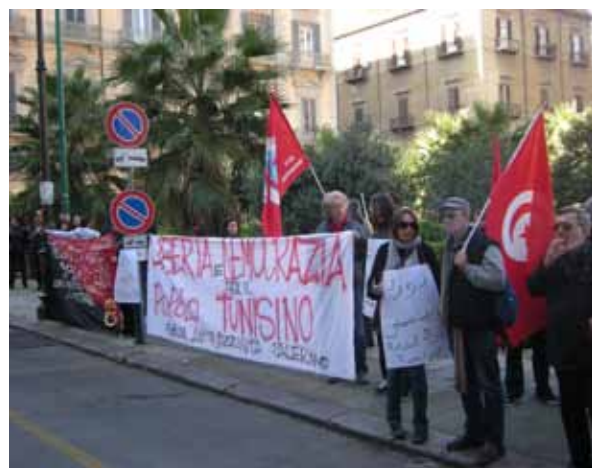
Kundgebung vor dem tunesischen Konsulat, Palermo

Durch das in Sizilien entstandene Netzwerk können regelmäßige politische Aktionen geplant und durchgeführt werden. Gemeinsam mit dem antirassistischen Netzwerk in Palermo nahmen VertreterInnen von borderline-europe an zahlreichen Veranstaltungen und Kundgebungen in Palermo teil, um über die unmenschlichen Bedingungen von Flüchtlingen aufzuklären.