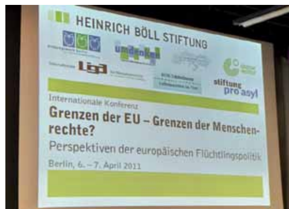
Konferenz der Heinrich-Böll Stiftung in Berlin