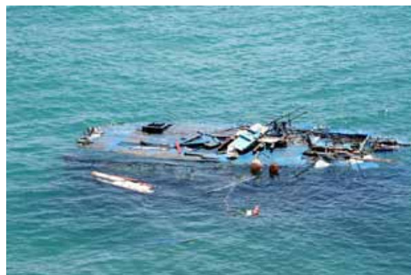
Gesunkenes Boot im Hafen von Lampedusa

Kriege, Umweltkatastrophen, ungerechte Wirtschafts- und Handelsbedingungen zerstören Lebensgrundlagen und veranlassen Menschen zur Flucht. Ihre Suche nach internationalem Schutz und einem Leben in Würde und Freiheit endet oftmals – und vielfach tödlich – an den Außengrenzen der Europäischen Union. Der tragische Tod dieser Menschen steht im Kontext einer gemeinsamen Europäischen Migrations- und Asylpolitik. Die politisch gewollte Abriegelung der Außengrenzen muss zurückgenommen werden.