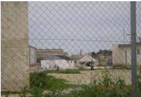
Malta, Flüchtlingslager Hal Far, 2011

Besonders hervorzuheben sind an dieser Stelle die Konferenz „Grenzen der EU – Grenzen der Menschenrechte“, die im April 2011 von der Heinrich Böll Stiftung in Berlin organisiert wurde sowie die Veranstaltung „Irregular Migrations in European Islands“, die im Dezember auf Malta stattfand und auf der eine Mitarbeiterin von borderline-europe über die Situation auf Lampedusa im internationalen Kontext informierte.