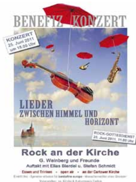
Sommerkonzert in Carlow

Aspekt der Öffentlichkeitsarbeit, aus dem im letzten Jahr zahlreiche Projekte entstanden sind. So wurden auch 2011 erneut zahlreiche Benefizveranstaltungen in Zusammenarbeit mit Vereinen und KünstlerInnen durchgeführt. An dieser Stelle sollen einige unvergessliche Veranstaltungen erwähnt werden. So wurden im Jahr 2011 gemeinsam mit der Evangelischen Kirche und dem Kulturverein Carlow gleich zwei Benefizkonzerte in Carlow organisiert. Das „Open Air“ im Sommer mit zahlreichen MusikerInnen zog über 600 begeisterte BesucherInnen an und wird auch im nächsten Jahr stattfinden. Auch das Konzert im Dezember in der Kirche in Carlow war ein großer Erfolg.