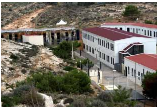
Aufnahmezentrum Imbriacola auf Lampedusa