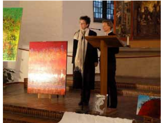
Bischöfin Kirsten Fehrs (links) mit Angelika Beer, in der Jakobikirche Hamburg

In der Hamburger Jakobikirche fand am 13. November anlässlich des jährlichen „Requiem für die Toten an den EU-Außengrenzen“ eine Kunstauktion statt. 40 Bilder von Noah Wunsch, Günter Grass, Armin Müller-Stahl sowie zahlreichen weiteren KünstlerInnen wurden zu Gunsten von borderline-europe unter den 300 Gästen versteigert.