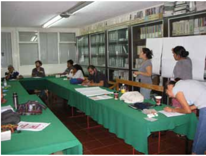
Ausstellung über ein Menschenrechtsthema verwirklicht durch die Teilnehmer der zweiten Menschenrechtsschule des Andenkens, der Wahrheit und der Gerechtigkeit des Comité Cerezo, welche am 3. März 2012 begann und bis zum 23. Juni dieses Jahres andauert. Segunda escuela de educadores populares 2011.jpg