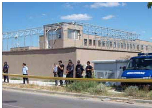
Abschiegegefängnis in Lyubimets, Bulgarien

Vom 25. bis 29. August 2011 fand in Siva Reka, Bulgarien - im Dreiländereck zu Griechenland und der Türkei - das No Border Camp 2011 statt. Rund 300 AktivistInnen, unter ihnen auch drei Mitgliedern von borderline-europe , kamen zusammen, um gegen die Militarisierung der Grenzen, die Eingrenzung der Bewegungsfreiheit über die Balkan-Grenzen, die Kriminalisierung von MigrantInnen und Flüchtlingen und die repressive Arbeit von Frontex zu demonstrieren.