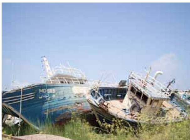
zerstörte Schiffe der tunesischen Fischer auf Lampedusa, 2011

Lebensgrundlage – sie konnten nicht mehr fischen, da ihre Boote konfisziert wurden.