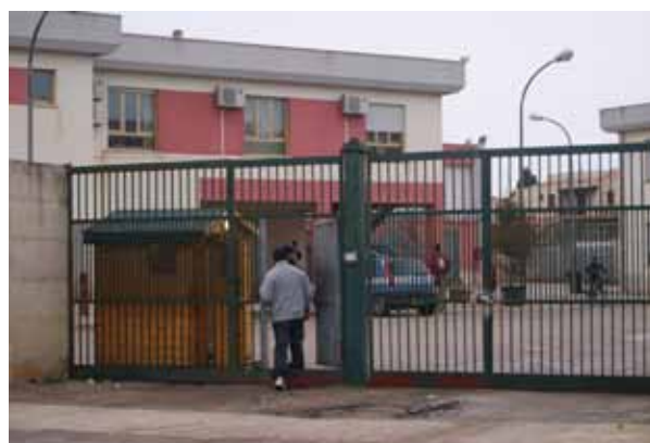
Salingrande, Aufnahmezentrum für Asylsuchende in Trapani

In Sizilien besteht eine enge Zusammenarbeit mit dem Schwesternverein Borderline Sicilia, dem antirassistischen Forum Palermo, dem Anwaltsverein ASGI, dem Netzwerk der Beratungsstellen, der Universität Palermo und zahlreichen lokalen Gruppen, JournalistInnen und Einzelpersonen.