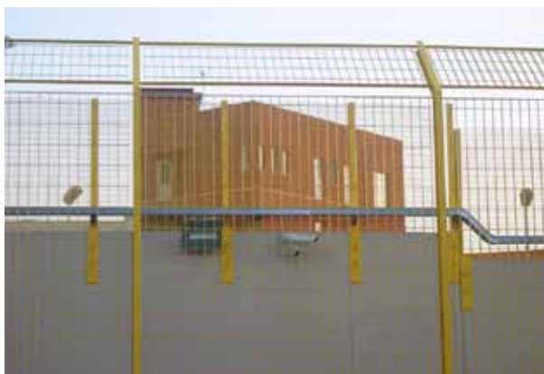
Abschiebezentrum in Milo, Trapani

Unter der neuen italienischen Regierung Monti wurde Ende des Jahres der Runderlass aufgehoben, der es bis dato JournalistInnen und unabhängigen BeobachterInnen in Italien untersagte in die Abschiebezentren zu gelangen. Um gegen dieses Unrecht aufmerksam zu machen, entstand die Kampagne „LasciateCIEntrare“ („Lasst uns herein – in die Abschiebezentren“), an der sich VertreterInnen von borderline-europe in Sizilien beteiligten. Da die offizielle Aufhebung noch keine Garantie für die tatsächliche Erlaubnis die Zentren betreten zu können darstellt, wird die Kampagne in den kommenden Monaten weitergeführt und die aktuelle Entwicklung werden genau beobachtet und dokumentiert.