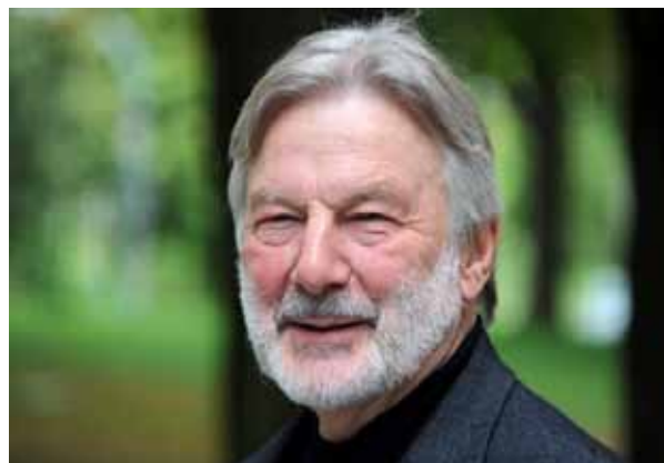
Neuer Flüchtlingsbeauftragter Stefan Schmidt

Ein weiteres an dieser Stelle zu erwähnendes Ereignis des letzten Jahres war die einstimmige Wahl des Gründungsmitglieds Stefan Schmidt zum Beauftragten für Flüchtlings-, Asyl- und Zuwanderungsfragen in Schleswig-Holstein durch den Landtag in Kiel.