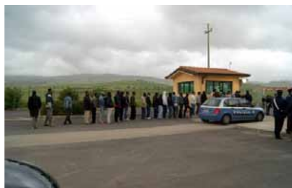
Eingang Mineo, größtes europäischen Aufnahme- lager für Flüchtlinge auf Sizilien

1700 ausgewählte Verlinkungen zu Artikeln sowie Hintergrundberichte und News veröffentlicht. Die Homepage wurde im Schnitt 10-12.000 pro Monat aufgerufen. Der Fokus der Auswahl liegt zwar auf den Ereignissen an den EU-Außengrenzen, beinhaltet jedoch auch Berichte über die Situationen von Asylsuchenden und Flüchtlingen generell in Europa sowie Geschehnisse in anderen Grenzgebieten.